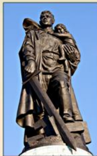
Берлин Монумент «Воин-освободитель»