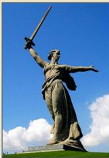
Волгоград Скульптура «Родина-мать зовет»