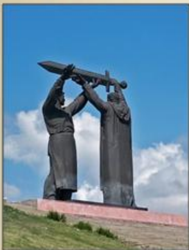
Магнитогорск Монумент «Тыл - фронту»

«Меч, который выковали уральские кузнецы, подняла Родина-мать в Сталинграде, а опустили его советские воины в Берлине, одержав победу в Великой Отечественной войне»