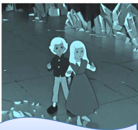
Кай и Герда