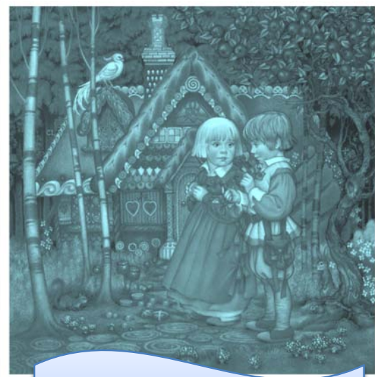
Гензель и Гретель